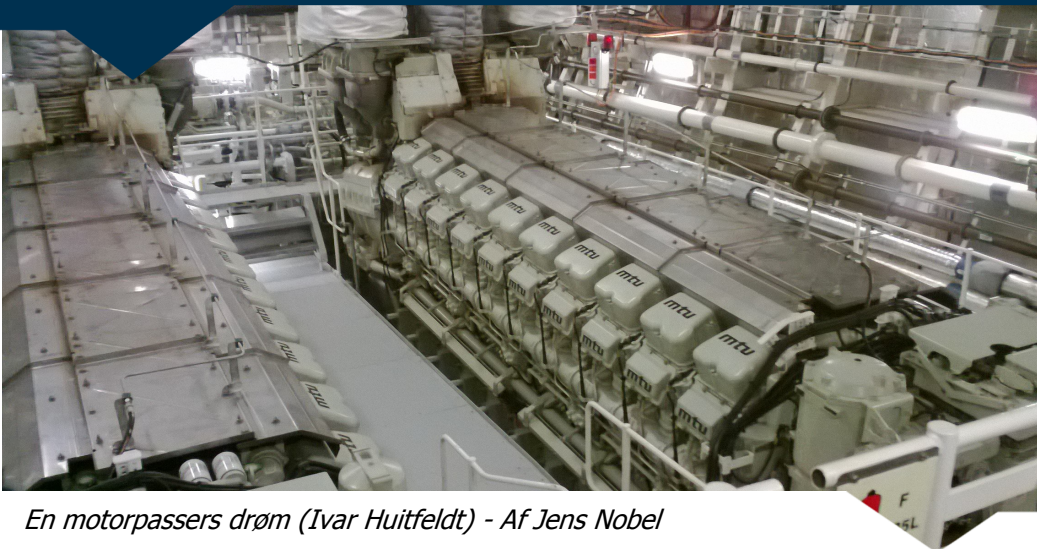
En motorpassers drøm (Ivar Huitfeldt) - Af Jens Nobel